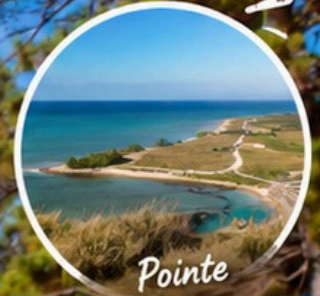
Pointe de Gâteau