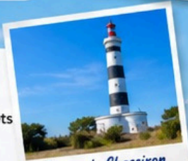
Phare de Chassiron